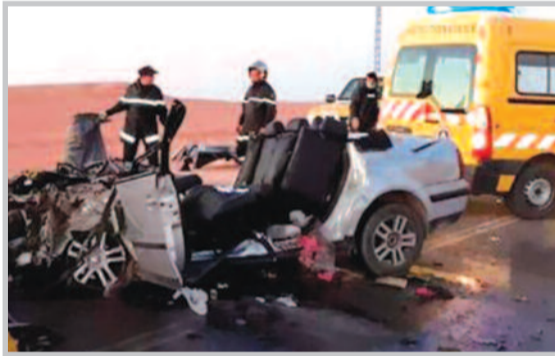
لؤي - ع

سجلت وحدات الحماية المدنية، خلال الـ 24 ساعة الأخيرة 179 تدخل على إثر عدة حوادث مرور سجلت عبر عدة ولايات، خلفت وفاة 06 أشخاص وإصابة 195 آخرين بجروح مختلفة ومتفاوتة الخطورة، تم إسعاف الضحايا في عين المكان وتحويلهم إلى المصالح الاستشفائية. إلى جانب هذا، تدخلت عناصر الحماية المدنية لولاية الجزائر على إثر وفاة 01 شخص يبلغ من العمر 53 سنة مختنق بغاز أحادي أكسيد الكربون وكذا إصابة شخصين آخرين بصعوبة في عملية التنفس على إثر استنشاقهم لغاز أحادي أكسيد الكربون المنبعث من جهاز سخان المياه داخل منزلهم المتواجد بحي 1040 مسكن، بلدية تسالة المرجة، دائرة بئر توتة، تم التكفل بالضحايا