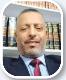
دوام الثناء والمحاسبة..!