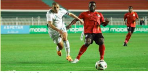
سيساهر في هذه الجولة من التصفيات الإفريقية إلى مالابو لمواجهة غينيا الاستوائية يوم 17 جوان، وهو ما يعني أن منتخب نسور قرطاج لن يكون في مشكلة كبيرة قبل السفر إلى الجزائر لمواجهة الخضرويدا.