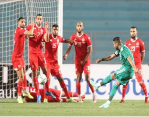
رابطة سطييف لكرة القدم