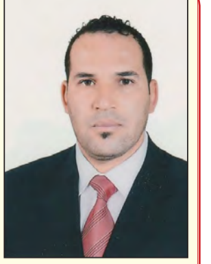
بقلم الدكتور محمد ناصري جامعة تبسة

أمام عجز السلطات الاستعمارية على إخماد لهيب الثورة المسلحة لجأت إلى إتخاذ إجراءات وحشية استهدفت الثورة بإبعاد الحاضنة الشعبية عنها من خلال عمليات تهجير السكان وإرغامهم على التخلي عن ممتلكاتهم عن طريق إتباع سياسة إنشاء المحشذات والمناطق المحرمة.