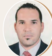
بقلم: معمر ناصري ص 8

الإستراتيجية الإستعمارية في مواجهة الثورة