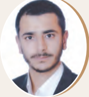
بقلم: إبراهيم أبو عواد ص 7

أسئلة عن المجتمع والثقافة والهوية الإبداعية