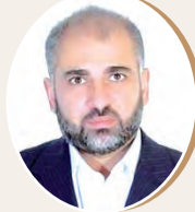
بقلم: مصطفى يوسف اللداوي ص 7

أسئلة عن المجتمع والثقافة والهوية الإبداعية