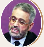
بقلم: أحمد محمود عيساوي ص 9

الأمية العلمية والفكرية والثقافية والسياسية