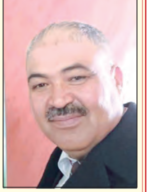
الحفناوي بن عامر غول الحسني

كما عودتنا دائما جريدتنا الغراء (الوسط) في الترجمة لأعلام الجزائر وبالسبق في التطرق للكثير من الشخصيات الثقافية والعلمية، هاهي اليوم على موعد مع القارئ لكي تساهم في رفع ونفض الغبار عن زينة المدينة العريقة (الأدرسية حاليا) الواقعة غرب الجلفة وعن احد أهم الشخصيات التي عرفت في منطقة أولاد نايل ، ويعتبر من أقطاب الطريقة الرحمانية الخلوتية ومن أرباب التصوف الأستاذ الأكبر المربي الفقيه الصوفي الشيخ عبد القادر بن مصطفى طاهري الزيني المولود سنة 1291هـ الموافق لـ 1873م بمدينة زينة، سليل الولي القصب سيدي امحمد بن صالح .