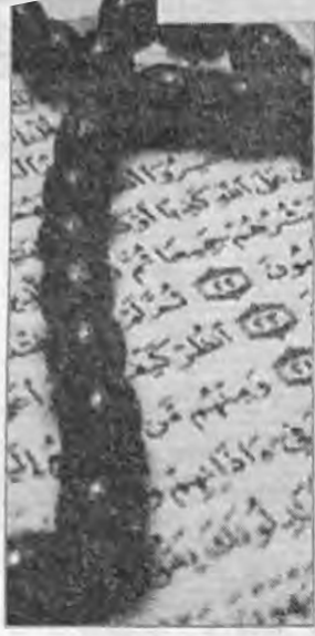
فلاس وتلمنن فلاس لوماس يلا امر اثبشرون

افتحبي ان ب العند ار رفكنا افوين نالخير نغ مايلا يسمعيث نغ احزيت نغ يكس فلاس رب اين اتقرحن نغ اين ارتضون يلا نغ وشبيح نغبي فلاس نغاليث ارب ذ سلاميس اسجد انشتاك يلا اخدميث العند اكن ارد سيفن امك اقوكلال رب ثمرت اكن ار تحمند واث شكرن لعياذيس غف يال اين ازندفكا ذ الخير نغ ثوكسا نالشر ابتادم غس اين يشكر اور يزمر ان يصوظ اتد اريفك نغ ان افاضع الخير ارب ذشو كان يسبفند وشبيح نغبي فلاس نغاليث ذ سلام ارب ثوتسرا اكن ماشي كان اسواوال ذغا اس لفعال امي ذين يلا اخدم اسيمانيس وذاسيفن السنة اك في غفلن نغورنغ اينسون مدن العند اكن ار ثودرت اتسن واذا اسحيون يوث نالسنة ايتون اطاس تيعدان.