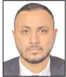
بقلم: عبد اللطيف خضر