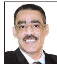
بقلم: رشوان ضياء

الرئيس المنتخب إيمانويل ماكرون للمرة الثانية، ولكن بزيادة نسبتها من نحو 34 في انتخابات 2017 إلى أكثر من 41 في الانتخابات الأخيرة، مترافقاً مع حصول حزبه على 89 مقعداً، ليصبح أكبر حزب معارضة في الجمعية الوطنية مع خسارة الرئيس ماكرون الأغلبية المطلقة. وفي إيطاليا، حقق اليمين المتطرف ممثلاً في حزب «إخوة إيطاليا» بزعامه جورجيا ميلوني مع حليفه حزبي «رابطة الشمال» و«فورزا إيطاليا»، فوزاً غير مسبوق بالسيطرة على مجلسي البرلمان وتولي رئاسة الحكومة.