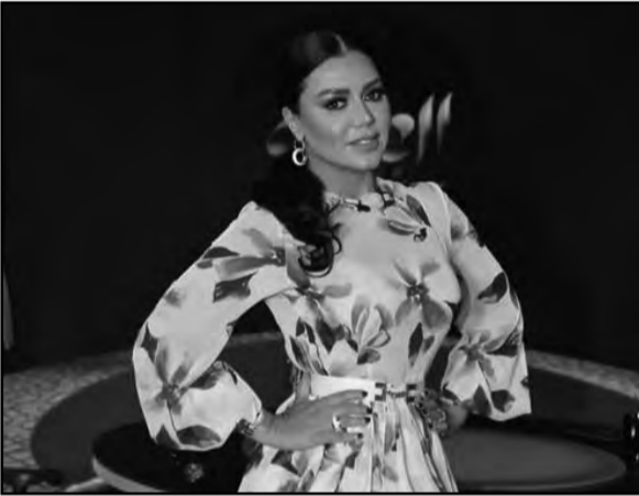
سأنا أحب ألبس الذي يليق مفتوح أو مقفول". عليها، سواء قصير أو طويل أو ق٣

بالنسبة لي والباقيين لا، وعلاقتي بأبو بناتي ليست جيدة وكنت أتمنى إننا نبقى أصدقاء، وزيجتي الثانية كان قرار غلط ومع الشخص غير المناسب، وزيجتي الثالثة كانت تحت ضغط أو لادي وأولاده".